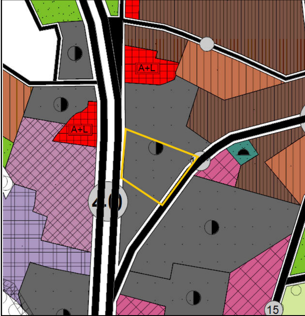
NAZIM İMAR PLANI MEVCUT DURUM