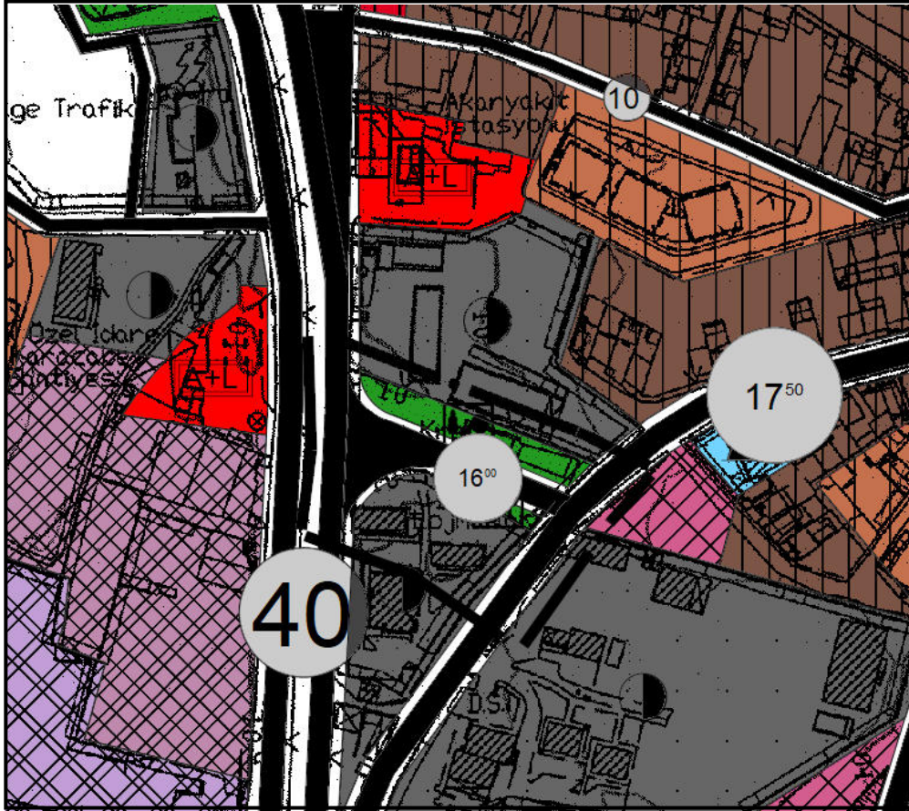
NAZIM İMAR PLANI ÖNERİ DURUM